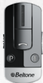
Phone Link 2